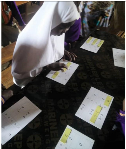
Der spilles koncentreret talloteri i total tavshed

I starten rakte eleverne blot hånden op for at få en brik. Ofte uden overhovedet at overveje om spørgsmål og svar hang sammen.