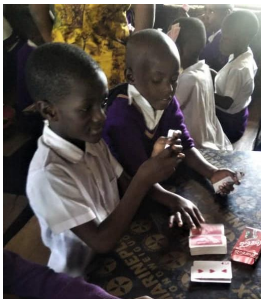
Der spilles aktivt og deltagende '31'

Det er fantastisk at høre hvordan eleverne virkelig tage spillene til sig og lærer dem. Tænk at forklare '31' til 70 elever på engang og så efter nogle gange at ende op med at de faktisk forstår det og spiller det korrekt. Se bare på billederne!!