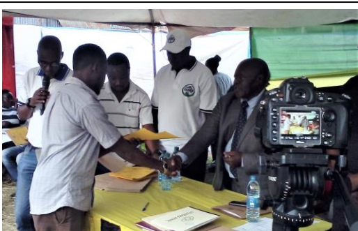
Regional Commisioner (i jakkesæt) overrækker deltageresdiplom

I skolen er aktiviteterne fortsat ufortrødent. Det er tydeligt at lærerne nu har tag om at forklare eleverne de forskellige lege og spil. I første klasse er det de samme spil og