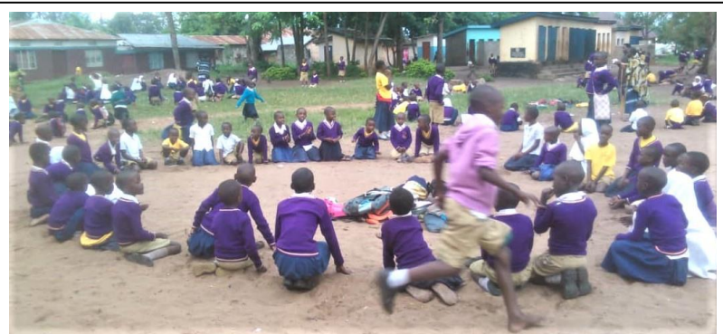
Hodi Hodi – Banke, banke BØF (se hvem, der løber om kap rundt om kredsen)

Der kom også en skoleleder og bad gruppen om at komme og træne hans lærere i det samme som de arbejder med på Mafumboskolen. Og det nye projekt vi arbejder på (se nedenfor) skal netop arbejde på at gøre Nyumba ya Watoto i stand til at gøre netop det: At undervise grupper af lærere og forældre.