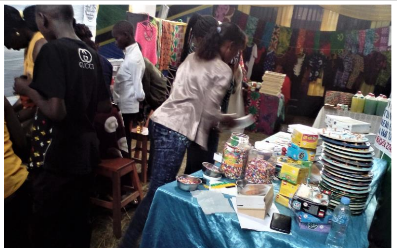
Livlig aktivitet på Nyumba ya Watoto's stand

I starten af juli deltog Nyumba ya Watoto i en stor handelsmesse' i Bukoba der løb over 12 dage.