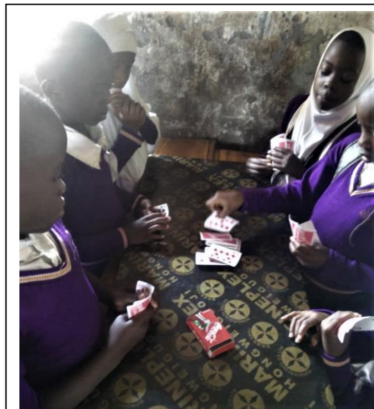
6 elever ved hver bordplade - '31'

En af betingelserne for det nye projekt er, at vi skaffer flere medlemmer. Så kender I nogen, der gerne vil give en 'hund' eller mere – ja – så er det jo dejligt. OG skulle nogen af jer have lyst til at hjælpe med regnskab eller andet, er I meget velkomne. Mvh Bestyrelsen