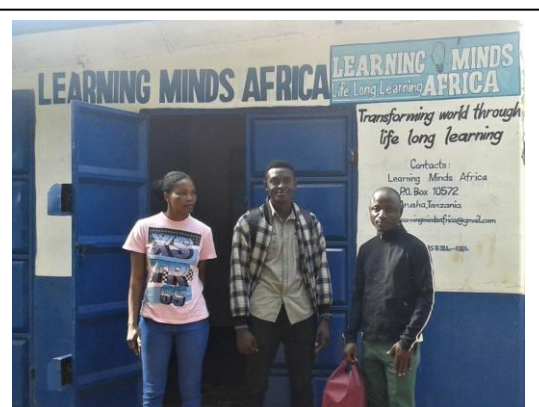
Samiath (t.v.) fra NyW besøger LEMA i Arusha. LEMA bliver vigtige partnere i det nye projekt.