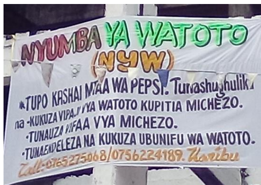
Banner for Nyumba ya Watoto

I slutningen af maj deltog vi i Odense Havnekulturfestival. Vi var der alle tre dage og fik 3 nye medlemmer. Til gengæld går vores puslespil ikke som de varme brød, vi troede de var.